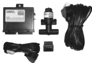
KIT REG-MATIC MILLENNIUM