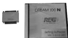
Software e chiave hardware

Per impianti DREAM 8 cilindri occorre ordinare n°2 cablaggi staccainiettori da 4 cilindri