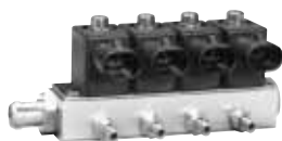
Dosatore DREAM XXI N