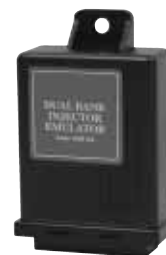
Dual bank injector emulator