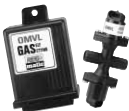
Centralina REG-MATIC Attuatore REG-MATIC