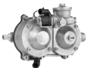
Riduttore DREAM XXI N