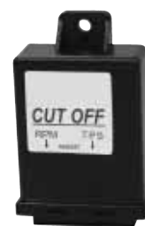
Dispositivo Cut-Off per TPS