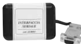
Interfaccia seriale REG-MATIC MILLENNIUM