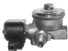
Elettrovalvola stabilizzatore completo per riduttori