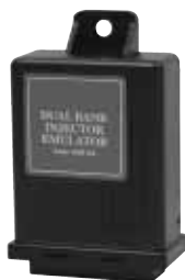
Dual bank injector emulator