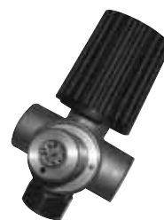
Valvola per bombola