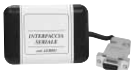
Interfaccia seriale REG-MATIC Millennium