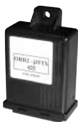
Emulatore OBD II-μFIX "425"