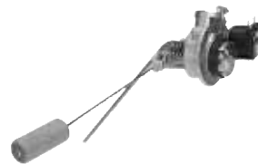
Multivalvola con dispositivo "Secure Block"