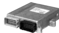
Centralina DREAM XXI N