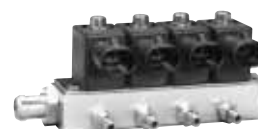
Dosatore DREAM XXI N