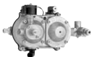
Riduttore DREAM XXI N