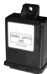
Emulatore OBD II-μFIX "425"