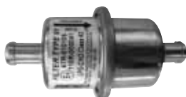
Filtro GPL fase gas