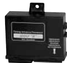
Variatore d'anticipo elettronico Modello "Wolf-N"

410326 Modello "Koala" RENAULT Kangoo - Clio - Megane 1.4 8V